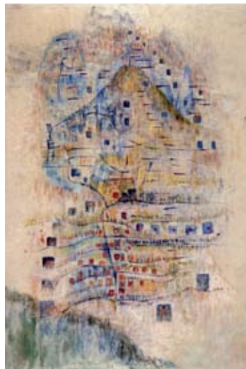
Alice Rahon, El volcán , s/f, Óleo sobre papel

Horario del museo: Martes a domingo de 10:00 a 17:00 hrs. Entrada libre