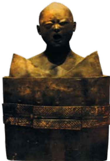
Mujer, 2010, Cerámica

Conjunto de 16 cerámicas realizadas por Jorge Marín como un homenaje a la milenaria tradición de la cerámica, en las que conjuga destreza técnica y belleza, teniendo como referencia extraordinarias piezas prehispánicas.