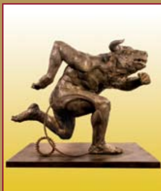
Flor Minor, Minotauro II , 2008, Bronce, Colección de la Galería Cósica.

Material de Distribución Gratuita / Prohibida su venta