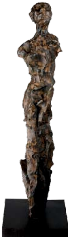
Figura femenina, 2008, Broce patinado

Consulta nuestras exposiciones itinerantes disponibles en: www.apartados.hacienda.gob.mx/cultura/apartados/museo/index.html