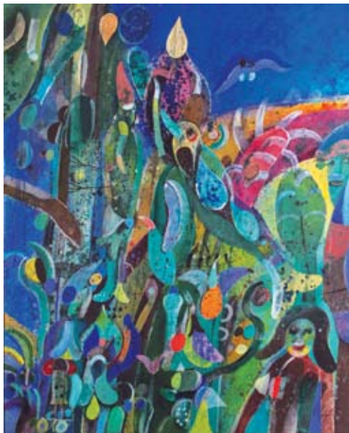
La madrugada , 2000, Acrílico sobre tela

La selección de piezas que integran la muestra Edén, está compuesta por 25 obras entre pintura y dibujo representa un recorrido visual por la producción de este creador, quien a lo largo de más de cinco décadas ha consolidado un lenguaje creativo que lo hace ampliamente identificable como uno de los artistas más representativos del arte mexicano.