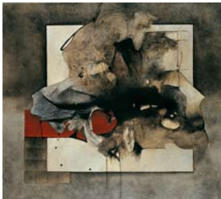
Estrella lejana, 1973, Acrílico sobre tela

La Colección Pago en Especie de la Secretaría de Hacienda y Crédito Público, contiene en su acervo una vasta selección de obras que brindan una importante visión del trabajo de los creadores y del contexto del arte mexicano de mediados de siglo XX hasta nuestros días. De entre ellos, dos figuras destacan del llamado movimiento de Ruptura: Vicente Rojo y Manuel Felguérez. Si bien Rojo ha explotado al máximo las posibles variantes del plano, la forma y el color, Felguérez, con el tiempo, ha concedido a la rigurosidad geométrica, la curvatura y vitalidad de las formas orgánicas de carácter lírico.