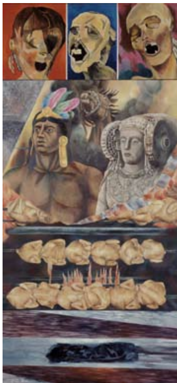
Dulce María Nuñez, Pollos rostizados , 1992, Mixta sobre madera

Esta selección reunida bajo el título de Universos Femeninos, pretende dar a conocer la producción artística realizada por artistas mujeres con que cuenta el acervo constituido del Museo de Arte de la SHCP, Antiguo Palacio del Arzobispado. La suma de la riqueza individual del trabajo de cada una de ellas conforma un conjunto de enorme caudal plástico que se ve reflejado en esta muestra.