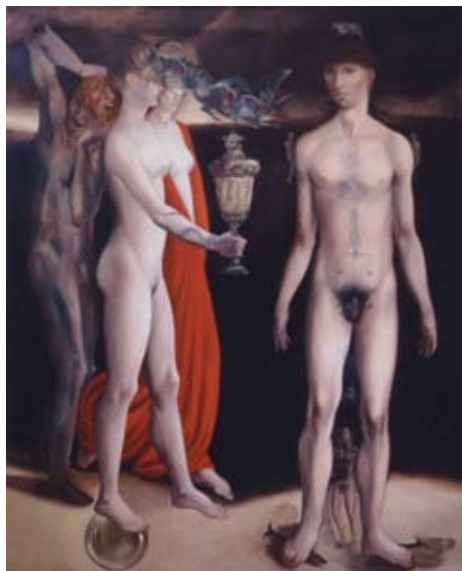
La Fortuna , 2010, Óleo sobre lino

En esta muestra Benjamín Domínguez busca que los excesos, por medio del sentido de la vista, logren que la piel de los cuerpos articulen visiblemente el mensaje de los estados de ánimo. Este conjunto de 50 obras reflejan la belleza del cuerpo y logran conmover al espectador a través de la representación de diversas emociones, que van de lo sublime a la perversión.